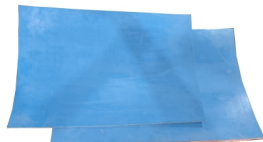
KAPHER DE TURBINA Y DESCARGA