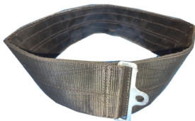
FAJA MANGUERA 300mm