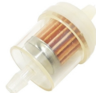
FILTRO DE NAFTA