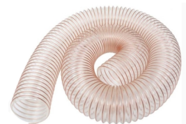
MANGUERA Ø200mm 5M