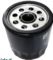
FILTRO ACEITE MOTOR